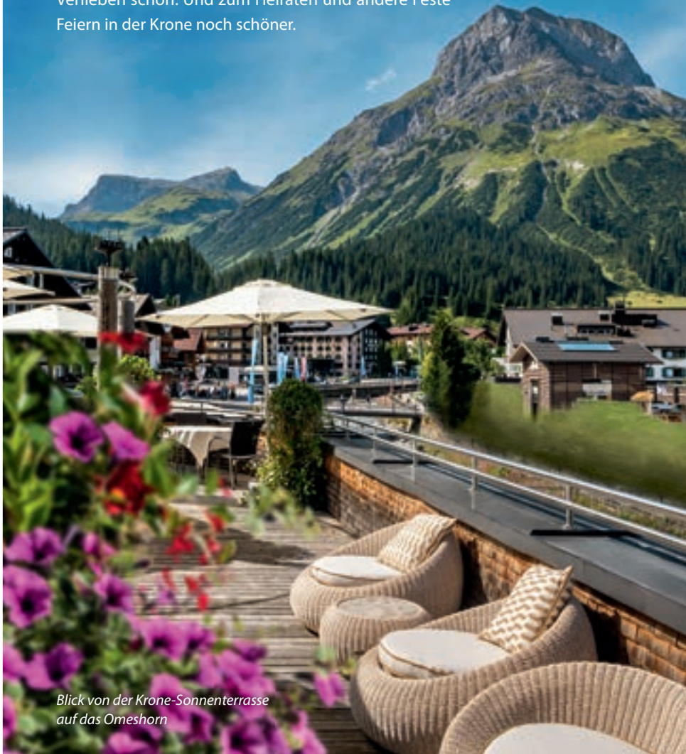
Blick von der Krone-Sonnenterrasse auf das Omeshorn

Wandern tut (gesundheitlich) gut in der majestätischen Bergwelt von 1.450 Metern Seehöhe aufwärts. Am Rad läuft's dank Energie aus dem Akku auch bergauf rund. Und Spielen ist auf dem höchstgelegenen Golfplatz der Alpen noch schöner. Wie immer Sie sich im Bergsommer bewegen, das beeindruckende Panorama, die horizontweiten Omeshornblicke, die grünen Spielwiesen, die erfrischenden Bergseen. All das ist zum Verlieben schön. Und zum Heiraten und andere Feste Feiern in der Krone noch schöner.