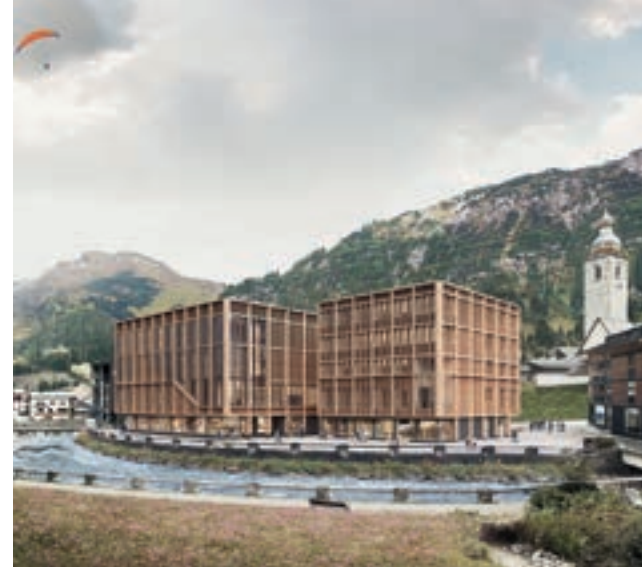
17. – 23.06.2024 Eröffnung »Lechwelten & Dorfhus«

Die Veranstaltungen gehören zu Lech wie das Omeshorn, das Huber Hus und in Kürze auch die beiden Gebäude »Lechwelten & Dorfhus«; zwei architektonische Singuläre, die in ihrer Einheit das neue alpin-moderne Begegnungszentrum von Lech bilden – mit einer Brand Mall und einem Veranstaltungszentrum, in dem ein Teil der Events stattfinden wird. Der traditionelle Adventmarkt mit Kunsthandwerk, Weihnachtsspezereien und musikalischen Darbietungen bleibt dem romantischen Kirchplatz-Ambiente treu.