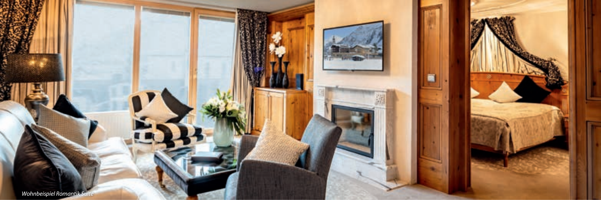
Wohnbeispiel Romantik Suite