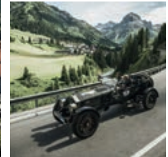
27. – 29.06.2024 Arlberg Classic Car Rally

Details inklusive Programm auf www.lechzuers.com Änderungen vorbehalten.