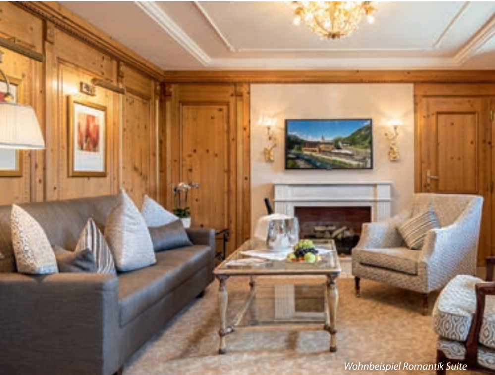
Wohnbeispiel Romantik Suite

Alle 53 Krone-Zimmer und -Suiten sind wie Privaträume gestaltet; mit viel Liebe zum Detail, mit auserlesenen Stoffen, edlen Materialien, ausgesuchten Accessoires und viel Gefühl für eine Harmonie von Farben und Formen.