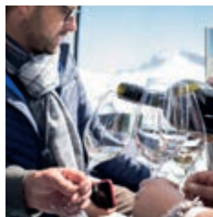
Anfang April 2024 Weingondeln am Arlberg