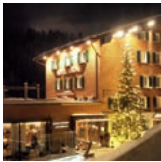
Dezember 2023 Adventmärkte Lech/Zürs/Zug