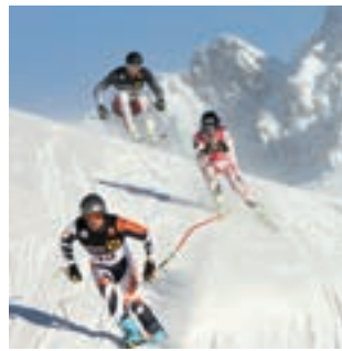
13.01.2024 Der Weiße Ring - Das Rennen