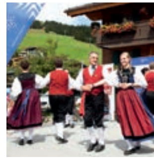
13.07.2024 Dorffest Lech