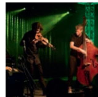
07. – 10.08.2024 Jazzbühne