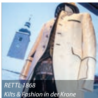
RETTL 1868 Kilts & Fashion in der Krone