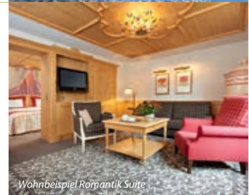
Wohnbeispiel Romantik Suite

02.12.2023 - 21.04.2024 530,- bis 810,- 27.06.2024 - 22.09.2024 250,-