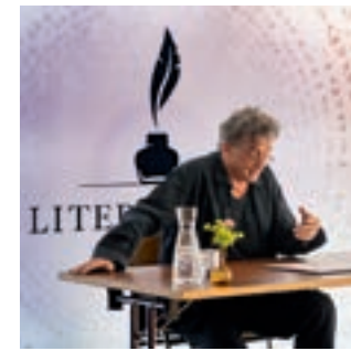
18. – 21.07.2024 Literaricum Lech