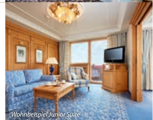
Wohnbeispiel Junior Suite

02.12.2023 - 21.04.2024 430,- bis 710,- 27.06.2024 - 22.09.2024 190,-