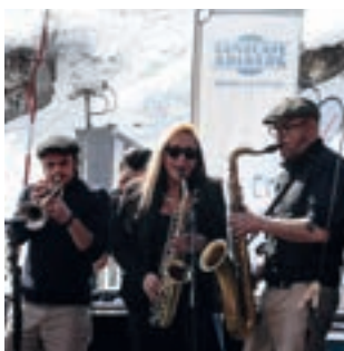
31.03. – 14.04.2024 Tanzcafé Arlberg