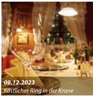
09.12.2023 Köstlicher Ring in der Krone