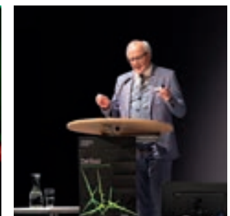
16. – 22.09.2024 Philosophicum Lech